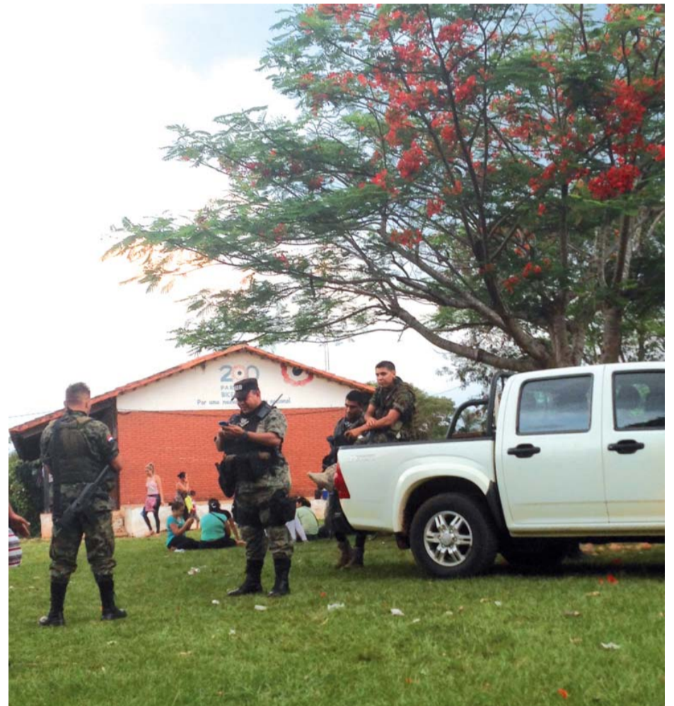
Uniforme para para'i. Desde la militarización, algunos policías cambiaron el uniforme azul por el para para'i lo que dificulta distinguirlos de los militares. Aquí custodiando un local electoral en Lima-San Pedro.

En el distrito de San Pablo, ex Coqueré, el 81,8 por ciento de los hogares urbanos y el 81,4 de los rurales tienen necesidades básicas insatisfechas (NBI); en General Resquín, el 77,2